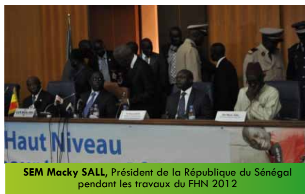
SEM Macky SALL, Président de la République du Sénégal pendant les travaux du FHN 2012

Vous êtes un acteur du secteur ou du développement local, un investisseur, un donateur, un expert ou tout simplement préoccupé par la question de l'eau et l'assainissement sur le continent africain, joignez-vous à nous pour qu'ensemble nous construisions une Afrique rayonnante et prospère, où chacun a accès aux services durables d'eau et d'assainissement.